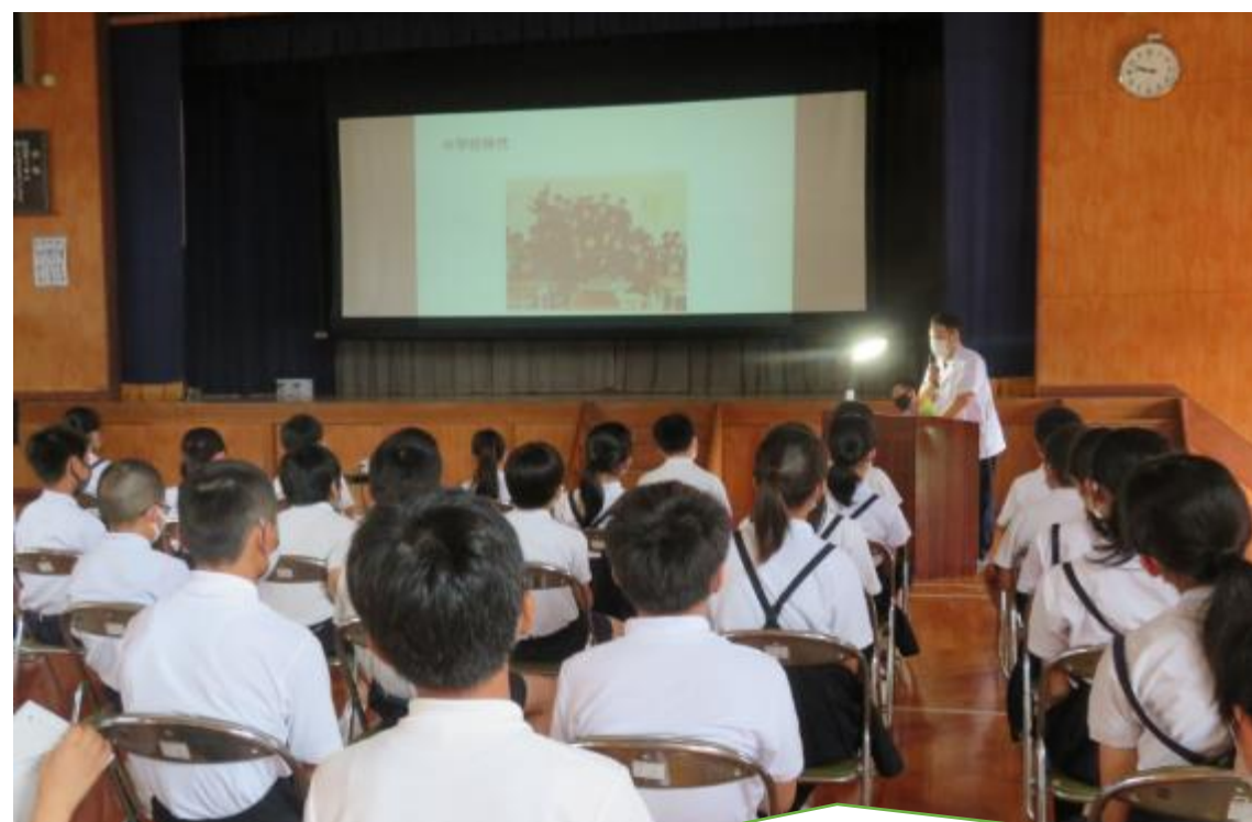
地域の和菓子職人さんに生き方を学ぶ