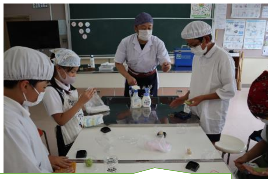
実際に和菓子作りを体験。