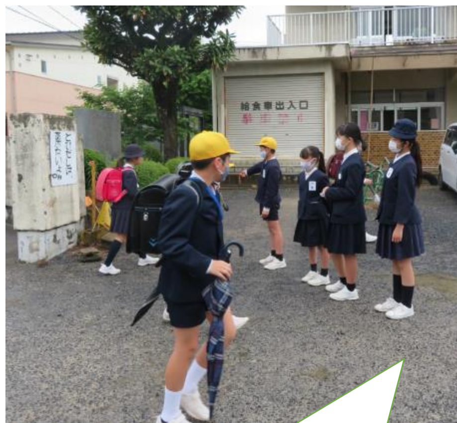
毎朝のあいさつ運動。自分から大きな声であいさつができたならシールがもらえます。クラスごとにあいさつの花にシールを貼っていったよ。