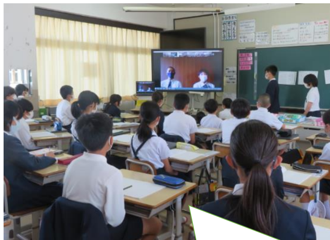
興譲館高校のあいさつ名人の生徒会長と野球部の部長にあいさつのコツについてインタビュー

◆単元のねらい「西江原小学校の良き伝統をさらに良くしていくために、課題を見付け、調べ、発信しんしていくことで、母校を思う心を育み、地域の人々の思いや願いを理解し、将来への自己実現に生かしていこうとする態度を育てる。