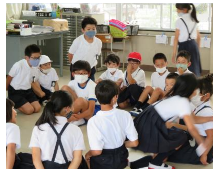
仲の良い学校作りグループ縦割り班での遊びを企画